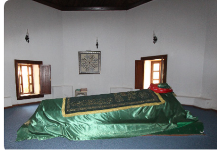
Ek 4. Çiçek Dede Türbesi, türbede yer alan mezarlara ait şahide taşı ve türbenin yanında bulunan gömü