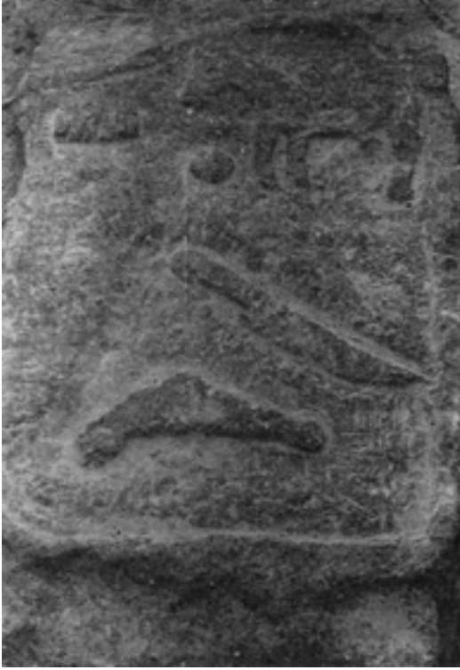
Resim 1: Iğdır / Ağaver Köyü Defnedilen şahsın, hayattayken en çok sevdiği eşyalarının temsili resmi mezar taşında görülmektedir.

"Kilitli kapı bin belayı önler,"(xviii) atasözünün mezar taşlarına motif olarak yansımaları oldukça enteresandır. Kars ve Iğdır yöresindeki kilit motifi kaynağı daha ziyade geleneksel "Türk aile yapısından" almıştır diyebiliriz. Zira, erkeğin evin reisi sayılması, hatta evin direği olarak kabul edilmesi, Türk aile yapısında az rastlanılan bir hadise değildir. Bundan dolayıdır ki, yöre halkı