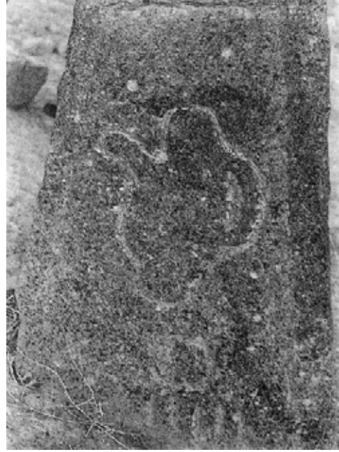
Resim 9: IĞDIR/ Aralık ilçe mezarlığında yer alan ibrik motifli bu mezar taşı; cömert ve fedakar insanların hatrasının halk nezdinde yaşatıldığını ifade etmektedir.