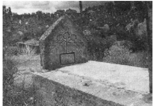
Resim 8. IĞDIR/ Melekli Beldesi. Genç yaşta vefat edenlerin anısına işlenen bir çiçek motifi görülmektedir.