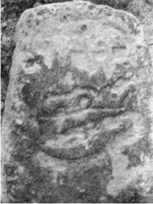
Resim 3. KARS /Kağızman ilçe mezarlığı Mertliğin, şecaatin resmi olan kılıç veya hançer kabartması.