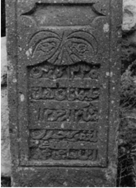
Resim 7: IĞDIR/Karakoyunlu ilçe mezarlığında bulunan kuş figürlü mezar taşı defnedilen şahsın geride bıraktığı iki erkek çocuğunu sembolize etmektedir.