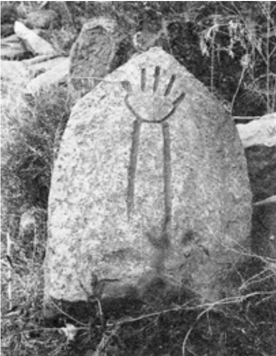
Resim 4: İĞDIR/ Karakoyunlu ilçesinin eski mezarlığında yer alan bu mezar taşı, defnedilen şahsın Şii-Caferi mezhebinden olduğunu belirtmektedir.