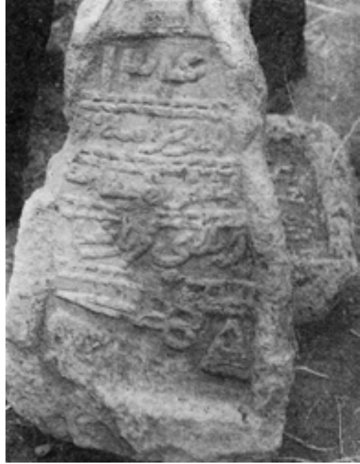
Resim 5: Ardahan il merkezindeki mezarlıkta yer alan bu mezar taşındaki makas motifi, mesleği terzi olanlara mahsustur.