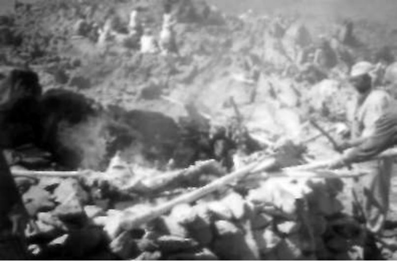
Resim 4: Çiçek Baba'da kesilen kurbanı ocaklarda çeviren ziyaretçiler.