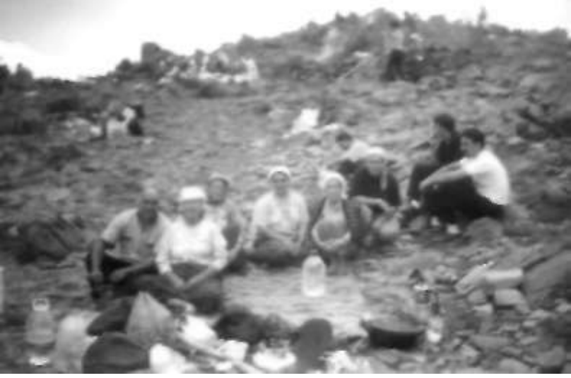
Resim 3: Çiçek Baba şenliklerine katılan bir gmp ziyaretçi.