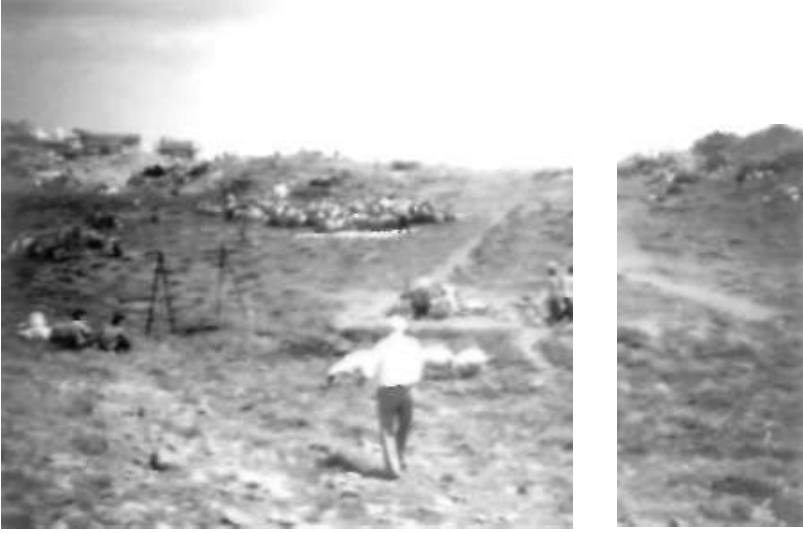
Resim 1: Çiçek Baba yatın ve namaz sonrası dua eden ziyaretçiler.