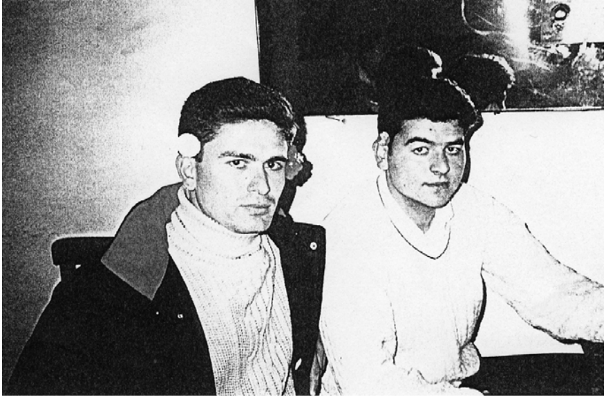
F.1. Yağşılar köyünden, nişanlı bir delikanlı (çift çiçekli=nişanlı) ile, Tekeler köyünden, sözlü bir delikanlı (tek yün çiçekli=sözlü) bir bayram günü Yağşılar köyü kahvesinde “muhabbet ederken”