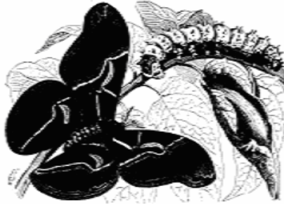
Resim 1: Ailanthus - yaban ipeęi keleşi, kurdu ve kozau (Rehmons, s. 277)