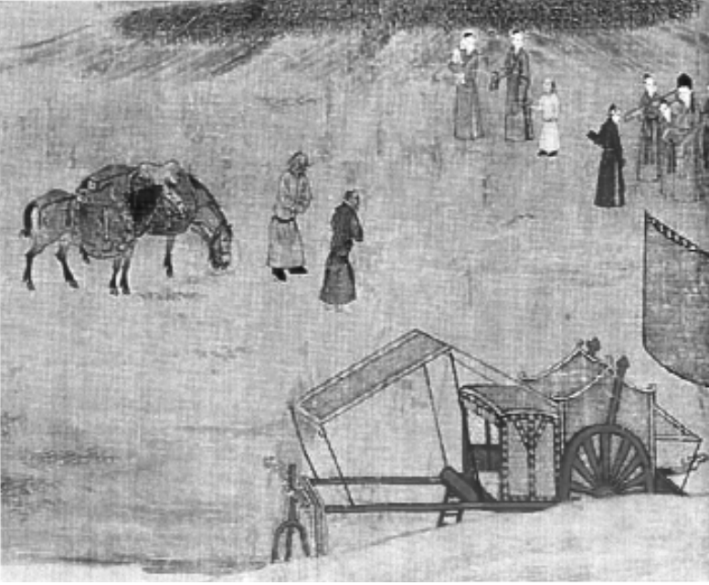
Wen-chi çocukları ve hizmetçileriyle gezinirken