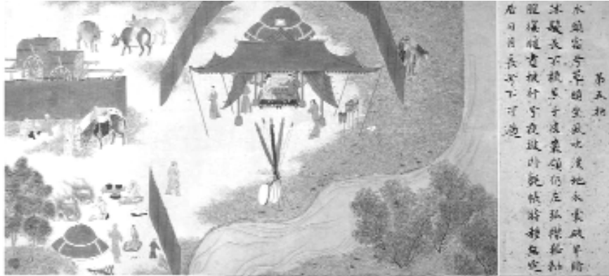
Hun beyinin gündelik yaşantısından bir sahne. Çinli eşiyle çadırında oturan beye kadınlar yemek servisi yapıyorlar. az ilerde mutfak olarak kullanılan çarın önünde aşçılar yemek yapıyorlar. Çadırın önünde ise beş renkli sancak ve davul görünmekte.