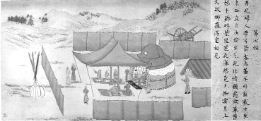
Hun beyi ve Çinli eşi Hun orkestrasından müzik dinliyor, görevliler ise yemek servisi yapıyorlar.