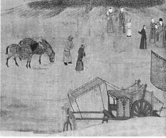
Wen-chi bebeğini emzirirken