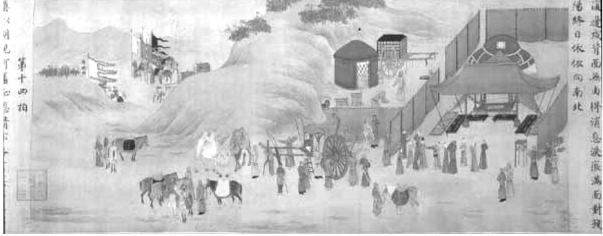
Ts'ai wen-chi'nin ülkesine dönmeden önce Hunlarla vedalaşmasının betimlendiği sahne. Arka tepelerden Çinli görevliler Wen-chi'yi almaya gelirken, hunlar ona araba ve yolluk hazırlıyorlar. Hun kadınları üzüntü içerisinde ağlaşıyorlar.