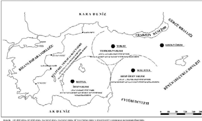
Harita 6. ANADOLU'DA SELÇUKLU DÖNEMİ KÜLTÜREL COĞRAFYA ve İDARİ BİRİMLER (1205-1211)

Harita 6. can altı günde, can altı günde, can altı günde, can altı günde, can altı günde, can altı günde, can altı günde, can altı günde, can altı günde, can altı günde.