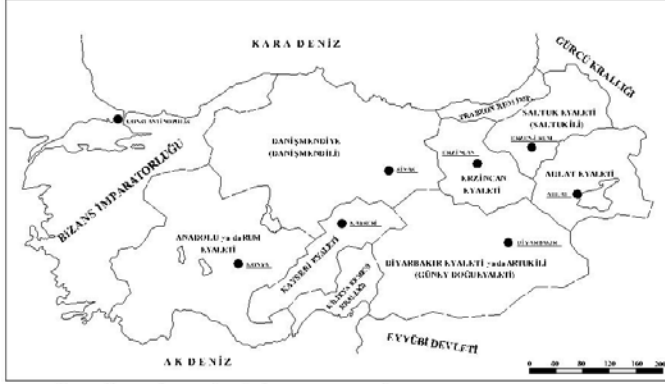
Harita 7. ANADOLU'DA İLHANLI DÖNEMİ SELÇUKLU İDARİ BİRİMLERİ (1237-1277)

Harita 7: 1237-1277 yılları arasında Selçuklu İdarî Birimleri (1237-1277) (Harita: 1:500.000, ölçek: 1:500.000)