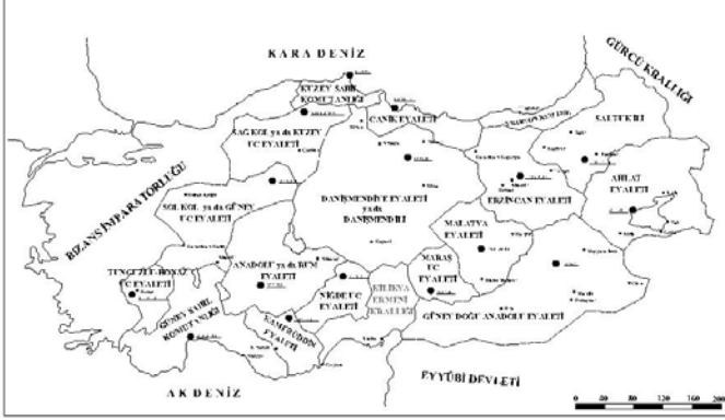
Harita 3. ANADOLU'DA SELÇUKLU DÖNEMİ İDARİ BİRİMLER (1211-1237)

Harita 3. BYZANS İMPARATORLUĞU, AK DENİZ, KARA DENİZ, CİCİLİ EYALETİ, SAKAR EYALETİ, CANSİR EYALETİ, DANİŞMENDİ EYALETİ, ERZURUM EYALETİ, AHLAT EYALETİ, MALATYA EYALETİ, SİVAS EYALETİ, ERZİNYER EYALETİ, NİĞİDE EYALETİ, KAYSERİ EYALETİ, GİRESUN EYALETİ, ANADOLU EYALETİ, SAKAR EYALETİ, GENÇ BÖGE ANADOLU EYALETİ, FİYÜBİ EYALETİ, GÜRCÜ KRALLIĞI, BYZANS İMPARATORLUĞU