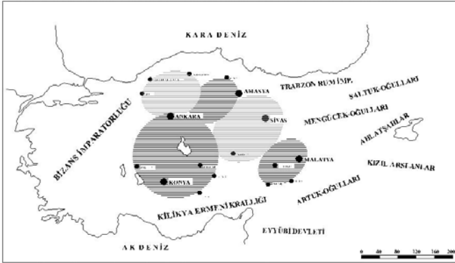
Harita 4. ANADOLU'DA SELÇUKLU DÖNEMİ İDARİ BİRİMLER / MELİKLIK PAYLAŞIMI (1155)

Harita 4. TRABZON RUM İMP., AMASYA, SAKAR OĞULLARI, MİNGÜÇEK OĞULLARI, AHLAT OĞULLARI, KIZIL ARSLANLAR, ARTUK OĞULLARI, KİLİKYA ERMENİ KRALLIĞI, FİYÜBİ EYALETİ, BYZANS İMPARATORLUĞU, AK DENİZ, KARA DENİZ