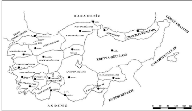
Harita 8. ANADOLU'DA SELÇUKLU DÖNEMİ SONUNDA ÇOK PARÇALI SİYASAL EGEMENLİK DÖNEMİNDE ORTAYA ÇIKAN YENİ DÜĞÜM-BAĞLANTI MERKEZLERİ (1277-1308)

Harita 8: 1277-1308 yılları arasında Selçuklu İdarî Birimleri (1277-1308) (Harita: 1:500.000, ölçek: 1:500.000)