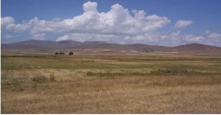
Ek 5: Mormoc Ovası