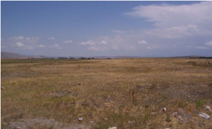
Ek 6: Mormoc