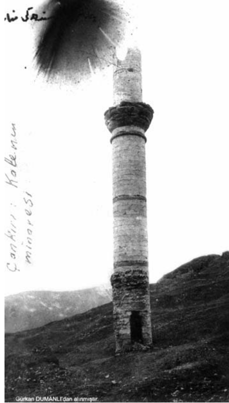
Fotoğraf:12 Çankırı Kalesi'ndeki Sultan Selim Camii'nin minaresi Photograph:12 Minaret of the Sultan Selim Mosque in the Castle of Çankırı