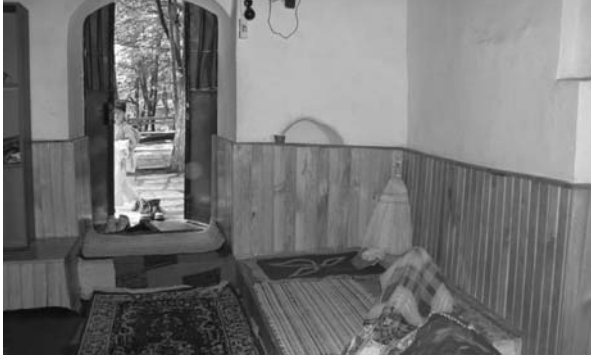
Fotoğraf: 5 Türbenin içinde kuzey –batısındaki sarnıç, batı kapısının ve yanındaki nişin içerden görünüşü.

Photograph: 5 Cistern within the Tomb in its northwest part, inside view of the western door and the adjacent niche.