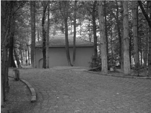
Fotoğraf:1 Emir Karatekin Türbesi'nin kuzey cephesi Photograph :1 Northern facade of the Emir Karatekin Tomb