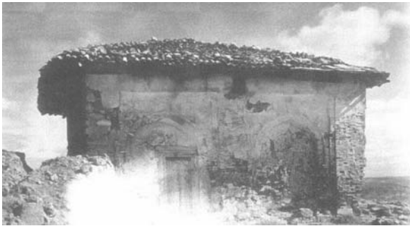
Fotoğraf:7 Türbenin batı cephesi. (Vakıflar Genel Müdürlüğü Arşivi'nden) Photograph:7 Western facade of the Tomb. (From the Archive of the General Directorate of Foundations)