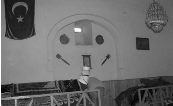
Fotoğraf:6 Türbenin güney duvarı. Photograph:6 Southern wall of the Tomb.

Photograph: 5 Cistern within the Tomb in its northwest part, inside view of the western door and the adjacent niche.