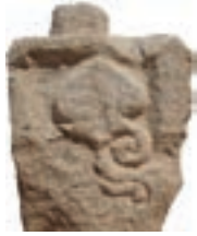
Resim 1. 15 nu

Yüzeyin tek motifle doldurulduğu örnekler (Resim 1-5): Genellikle sandık tipi mezarların kısa kenarlarının dar olan kuzey ve batı yüzleri ile kısa kenarın üstündeki tepelikte işlenmişlerdir. 7 örneği belirlenmiştir (Nu:15, 108, 232, 234, 243, 265, 266). 15 numaralıdaki birimin yan yana tekrarlandığı iki örnek (nu:147, 196) ayrı bir tip altında ele alınacaktır.