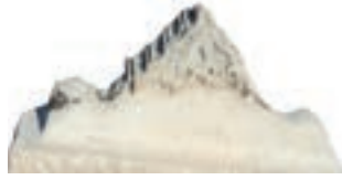
Resim 2. 232 nu