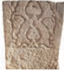
Resim 7. 164 nu (1382)