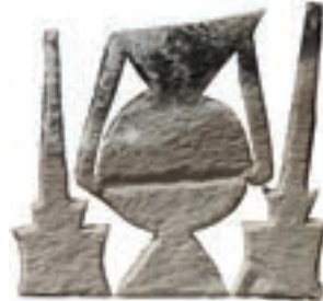
Resim 86. 183 nu