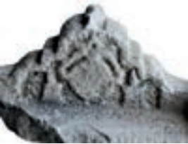
Resim 78. 82 nu