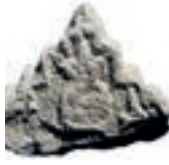
Resim 97. Etüdlük parça