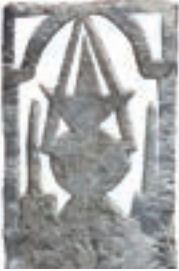
Resim 87. 189 nu (1308)