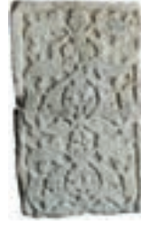
Resim 8. 109 nu