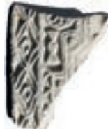
Resim 37. Etüdlük