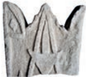
Resim 91. 245 nu