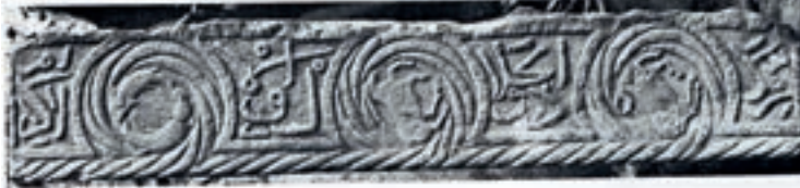
Resim 100. Karamağaralı 1992: Fot. 123

Hayvan figürleri (Resim 100): Vaktiyle Malatya Ulu Camisi'nde olduğu belirtilen ve bugün nerede olduğu bilinmeyen sandık mezar yan taşı olabilecek taşta üç çarkifeğin içindeki balık, oğlak ve boğa figürlerinin burçlara işaret ettiği kabul edilmiştir (Karamağaralı 1992: 29, Fot.123).