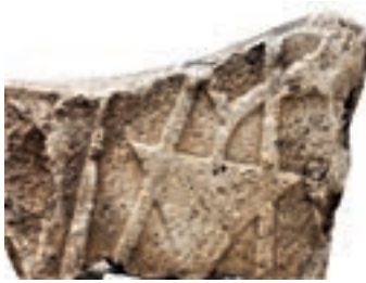
Resim 76. 2 nu