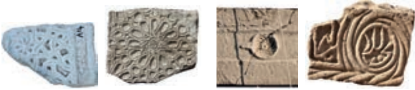
Resim 58. 42 nu. Resim 59. 307 nu Resim 60. 171 nu Resim 61. 97 nu

Yuvarlak çarkifelek (Resim 60-61): 30 örnek ile Malatya'nın ikinci yaygın grubudur (kat. 24, 36, 51, 53, 61, 62, 67, 68, 70, 80, 83, 88, 90, 92, 95, 97, 99 (1343), 102 (1346), 104, 135, 136, 148, 153, 171, 202, 203, 204, 233, 249, 284). Genellikle açık sandık mezarların yan taşlarının üst ve yan yüzlerinde urgan motifi ile beraber verilmişlerdir.