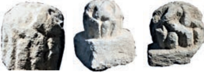
Resim 65. Etüdlük para Resim 66. Etüdlük para Resim 67. Etüdlük para