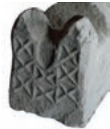
Resim 45. 271 nu

Üst üste yuvarlaklı s kıvrımları (Resim 46-47): İki örneği vardır (kat. 184 (1300?), 307). Birbirini takip eden "s" kıvrımlarının birleşme yerlerinde birer yuvarlak oluşturmasıyla zincire benzeyen bir biçim elde edilmiştir. Kırşehir'deki örneğini de (Karamağaralı 1992: Fot. 20) 14. yüzyıla verebiliriz.