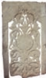
Resim 88. 201 nu