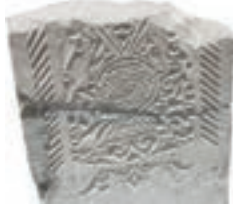
Resim 13. 156 nu