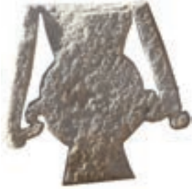
Resim 84. 180 nu