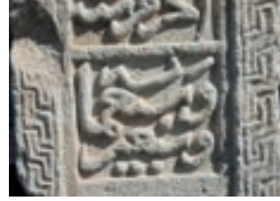
Resim 48. 296 nu

Zencirek (Resim 48): İki tarihli üç örneğinde de (kat.225 (1300?), 250, 296 (1368), kenar suyunda görülür. Beyşehir'de 1364, 1375 tarihli sandukalarda kuşak (Kunt vd 2014: 378-380), Niğde şehrindeki 1372 tarihli sandukada kenar suyu (Bağcı 2005: 28, örn.3), Konya'da 1474 tarihli sandukanın oturtmalığında (Başkan 1996: kat.22), Bursa'daki 1421 tarihli lahitte, Hıdır Şah (15. yüzyıl) ve Ahmet Çelebi'nin (15. yüzyıl) baş taşlarında, Edirne'de Sitti Hatun'un 1467 tarihli baş taşında, İstanbul'da Saraç İshak'ın 1487 tarihli baş taşında, Kısıklı'da 15. yüzyıldan bir baş taşındaki (Güven 1995: Fot. 71, 175, 181, 213, 271, 315), Tokat'ta 1341, 1408, 1410 tarihli mezar taşlarında (Karamağaralı 1971: Fot. 17, 23, 28) benzer örnekleri, 14-15. yüzyıllarda bu motifin yaygın olduğunu gösteriyor.