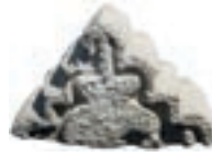
Resim 98. Etüdlük parça