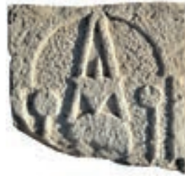
Resim 89. 213 nu