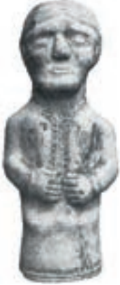
Resim 102. Karamağaralı 1992: 126. Fot.