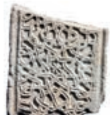
Resim 57. 296 nu