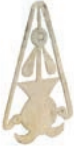
Resim 81. 93 nu