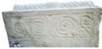
Resim 25. 291 nu

Yazı, kandil gibi ana düzenlemeyi tamamlayan bitkisel bezemeliler (Resim 26-35): Baş veya ayak taşlarında ana düzenleme olan yazıların ve kandillerin çevresi değişik biçimlerde kıvrık dallarla bezenmiştir. Bunların da ana yapısı, “s” biçimli dalın kıvrımları içine yerleştirilen rumilerden oluşur. 10 örnekte belirlenmiştir.