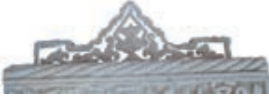
Resim 30. 293 nu