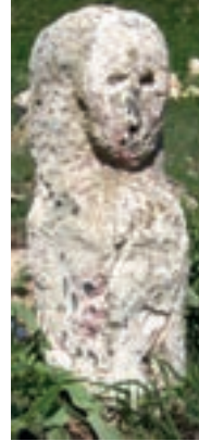
Resim 103. Malatya Akçadağ Derinkuyu Köyü'nden

İnsan yüzlü güneş Silvan Ebul Muzafferiddin Camisi minaresinde (1212), İncir Han taç kapısında (1238), 1240 tarihli sikkede iki aslanın arasında insan yüzlü güneş olarak, 1240, 1298, 1312 tarihli sikkelerde, 1297-1302 yılları arasında basılmış olabilecek iki sikkede insan yüzü olmayan güneş, olarak verilmiştir. 1293 tarihli sikkede ise büst şeklindeki insan başının çevresinden güneş ışınları çıkar (Çaycı 2002: 42, 44, 52, 53, 54).