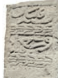
Resim 51. 189 nu

Sekiz dilime bölünmüş yuvarlak (Resim 50): Üç örneği de papatyaya benzer (kat. 158, 279, 302). Sekiz dilimli papatya Akşehir'de 1348 tarihli mezar taşında (Meriç 1936: 179, nu.81), Niğde'de 1407 tarihli sandukada (Bağcı 2005: kat.7), 12 dilimli Kırşehir'de tarihsiz bir örnekte (Göktürk 2008:188, sanduka 5), Erciş'te 14. yüzyıldan? (Uluçam 2000: Fot.162),