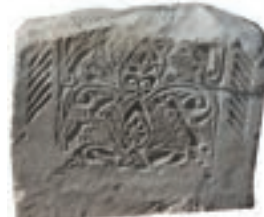
Resim 38. 155 nu