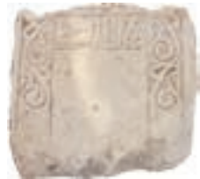
Resim 29. 231 nu