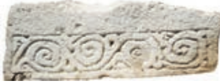
Resim 24. 178 nu