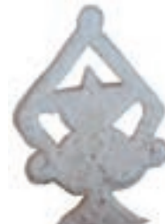
Resim 92. 293 nu