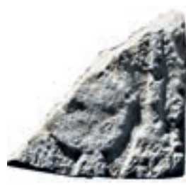
Resim 77. 4 nu