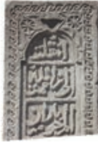
Resim 47. 184 nu