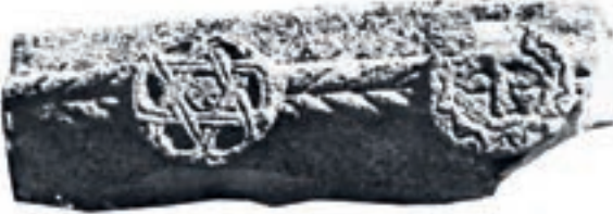
Resim 101. Karamağaralı 1992: Fot. 125

İnsan figürü (Resim 101-102): İki de kayıp iki örneğinden birincisi kazıma tekniği ile yapılmıştır. Sandık mezarın kısa kenarı olması gereken ve günümüzde kayıp olan taşta, urgan motifinin ucundaki yuvarlak çıkıntının yüzeyindeki insan yüzüne güneş denilmiş ve 13. Yüzyılın son çeyreği ile 14. yüzyılın ilk çeyreğine tarihlenmiştir (Karamağaralı 1992: 29, Fot.125). Mezarlıkta tarihi bilinen örneklerin çoğunun 14.yüzyıldan olması, bu tarihlemeyi doğrulamaktadır. Bu düzenlemede, insan yüzü ve yan kabarda gül motifi olarak kabul edilen düzenlemede gül gök çarkının, insan yüzü güneşin sembolü olarak kabul edilmiştir (Çaycı 2002: 47).