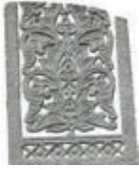
Resim 12. 200 nu