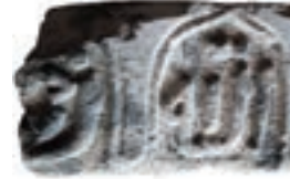
Resim 54. 114 nu

Sekiz uçlu yıldız (Resim 53): İki örneğinden biri 1300? yılındandır (kat. 225) diğeri de (kat. 242) 14. yüzyıla verebiliriz. Bu tür çok uçlu yıldız düzenlemesi, Selçuklu ve Beylikler dönemlerinde, çok kollu yıldızlara göre oldukça azdır. Sekiz köşeli yıldız Türk sanatında geç dönemde yaygınlaşır. Ancak burada olduğu gibi bir daire içinde ama bitkisel bezemeye birlikte verilen Kastamonu örnekleri 14-15. yüzyıldandır (Çal 2007b: 215-224). Cizre'de 1893 ve 1895 tarihli mezar taşlarındadır (İnci 2008: kat. 6, 11, 46). Kastamonu'da 1816 tarihli Girişkenler Evi'nde, 19. yüzyıldan Yanıklar Evi, Çatlakoğlu Evi, Çilhacılar Evi'nde (1816) (Çal 2008:157-168), Akseki evlerinde olduğu gibi (Yarar 2001:30,68,77,109,113) 19. yüzyılda tavanlarda çok yer verilmiştir.