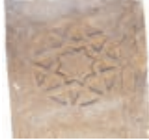
Resim 53. 225 nu