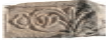
Resim 3. 243 nu