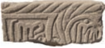
Resim 52. 153 nu

tarihli mezara (İnci 2008: kat.11) bakarak, az da olsa bazı bölgelerde sürdürüldüğünü söyleyebiliriz.