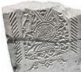
Resim 79. 156 nu