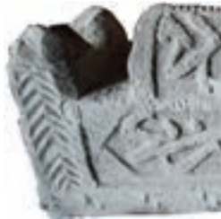
Resim 41. 271 nu