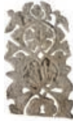
Resim 10. 3 nu