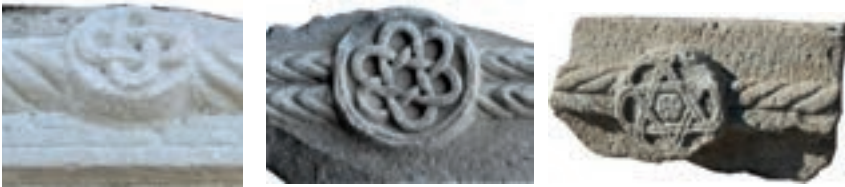
Resim 62. 291 nu Resim 63. (nu.1741 etüdlük) Resim 64. 85 nu

Niğde'de 1407 tarihli sandukada (Bağcı 2005: kat.7), Erciş'te Karakoyunlu dönemine tarihlenen mezarda (Uluçam 2000: kat. G-23), Gevaş'ta 14. yüzyıla verilen iki mezar taşında (Başak 2008: kat.1,4), Tokat'ta 1341, 1408, 1410, 1422 tarihli mezar taşlarında (Karamağaralı 1971: Fot.13,17,23), Göynük'te 1448 tarihli mezar taşında (Çal 2007c: kat.26), Edirne TİEM Sitti Hatun baş taşı (1467) kandil gövdesinde, İst. Kısıklı Camisi baş taşında (15. yüzyıl?) (Güven 1995: Fot.214,325) yer almıştır. Kırşehir'deki sandukada (14. yüzyıl) çarkifelek daire içindedir, iç dairesi kabara biçimlidir (Göktürk 2008: 195). Çarkifelek, Anadolu Türk sanatında her dönem yaygın bir motif olmakla birlikte örneklerimizdeki biçimiyle Malatya'ya özel bir tip olduğunu söyleyebiliriz.