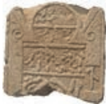
Resim 27. 228 nu