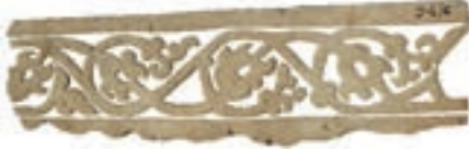
Resim 22. 194 nu