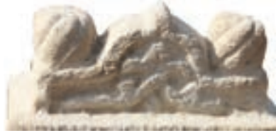
Resim 4. 265 nu