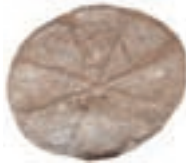
Resim 50. 302 nu