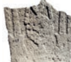
Resim 80. 163 nu (1436)