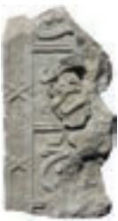
Resim 49. 306 nu

Yanları uzun uç uca altıgen tekrarları (Resim 49): Kenar suyu olarak tek örnektedir (kat. 306). Bu tür bezeme 19. yüzyılda ev tavanlarında yaygınlaşır.