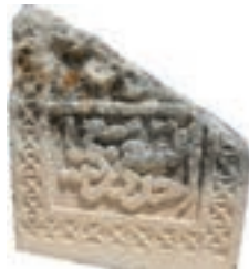
Resim 44. 243 nu