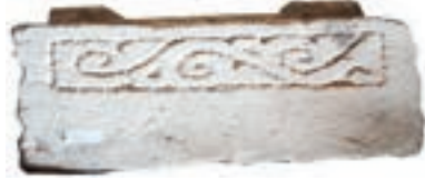
Resim 23. 52 nu