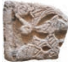
Resim 14. 56 nu