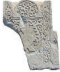
Resim 95. 304 nu