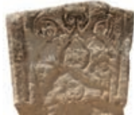
Resim 11. 89 nu