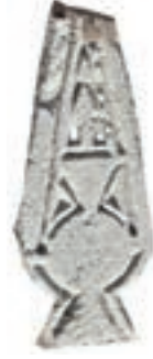
Resim 99. 312 nu

Bunlardan 162 numaralı 1359, 163 numaralı 1436, 162 nu. 1368, 189 numaralı 1308, 295 numaralı 1375 yılından olmak üzere beş tanesi tarihlidir.