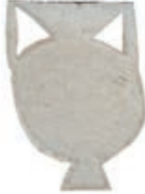
Resim 85. 165 nu