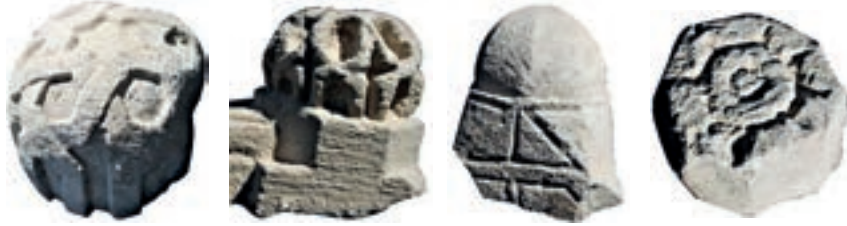
Resim 68. Etüdlük Resim 69. Etüdlük Resim 70. Etüdlük Resim 71. Etüdlük