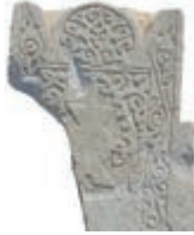
Resim 31. 304 nu