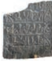
Resim 28. 217 nu