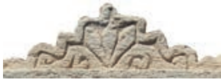
Resim 5. 234 nu

Küçük yüzeylerde yapıldıklarından işçilikleri kötüdür, basitleştirilerek işlenmişlerdir. 243 numaralı örneğimizdeki benzeri Tokat'ta 1422 tarihli mezar taşında yer alır (Karamağaralı 1971: 81).