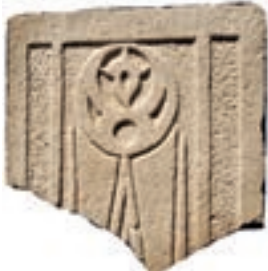
Resim 90. 221 nu