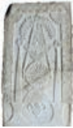
Resim 75. 1 nu

Erciş'te de tarihi bilinen biri 1315 tarihli, biri 13. yüzyıl, dokuzu 14. yüzyıla tarihlenmek üzere 11 örnektekiler genel düzenlemeye uygundur (Uluçam 2000: kat. e12, g26, y61, a76, u83, c8, ad6, ad7, ad5, ad8, ad11, ad12).