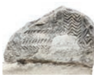
Resim 42. 106 nu