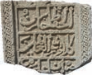
Resim 46. 307 nu