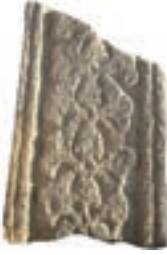
Resim 6. 212 nu

Birincisi rumi - palmetlilerdir. Bu gruba giren 12 örneğin (kat. 3, 56, 89, 109, 156, 164, 184, 200, 212, 298, 301, 313) ana yapıları aynıdır, yalnız ayrıntılarda değişiklikler vardır. Her birimde, bir kökten çıkan iki rumi yaprağı uçta birleşerek palmet, beş çenekli çiçek ve çok dilimli çiçek oluşturur. Ortadaki bu çiçekten çıkan iki kol tekrar iki yandaki birer rumi yaprağını oluşturmak üzere düzen devam eder. Yanlardaki bu rumi kollarından, devamı olmayan yapraklar çıkabilir. 3, 109 numaralılar yan rumi kolları ve ortadaki beş çenekli çiçek bakımından benzerdir. Ancak 109 numaralıda rumilerin ucundan palmete benzer birer çiçek daha çıkar. 313 numaralı ise rumi kollarının arasında bir değil iki palmetli oluşuyla ayrılır. 212 numaralı daha basit işçiliklidir. Palmet ve rumiler ayrıntılı değildir. 184 numaralıda ise ortadaki palmet klasik tiptedir, yalnız yanlardaki yapraklar alışıldık rumilerden farklıdır ve sapların yivli işlenişi ile diğerlerinden daha geç, 15.yüzyıldan gibi görünüyor. 298 numara rumi kolları arası, palmet – karanfil veya gülün üstten görünüşü biçiminde çok dilimli çiçek sıralaması ile düzenlenmiştir. 200 numaralısı da farklı olanlardandır. Küçük ve basit palmeti, iki rumi değil de hatayı üslubuna benzer bir yaprak çevirir. Bunlardan 184 numaralısı 1300?, 164 numaralısı 1382 olmak üzere ikisinin tarihi bellidir.