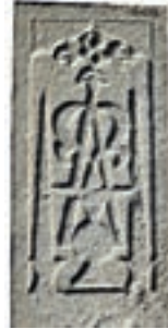
Resim 83. 182 nu (1368)