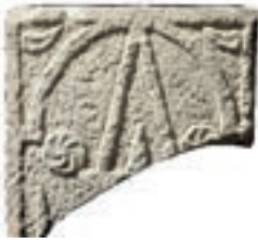
Resim 96. 309 nu