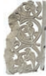
Resim 18. 306 nu (1300?)

Bu gruptan 164 ve 212 numaralılara daha çok benzeyenleri, Niğde Sungur Bey Camisi mihrabı (1335), Erzurum Çifte Minareli Medrese taç kapısı (1291), Erzurum Yakutiye Medresesi Taç kapısı (1310), Ahlat Erzen Hatun Kümbeti (1396), Niğde Gündoğdu Türbesi Taç kapısı (1344), Niğde Sungur Bey Camisi doğu kapısı (1335), Ahlat mezar taşında (1300) (Schneider 1989:162-163, nu.912-917), Konya'da Karamanoğulları döneminden 1411 tarihli sandukanın kısa kenarında (Başkan 1996:kat nu: 10) yer alır. 109, 301, 313 numaralı örneklerimiz kök kısmı itibarıyla Beyşehir'de 1375 tarihli sandukanın kısa kenarındaki (Kunt vd. 2014: 379) düzenleme gibidir. Karamanoğullarından 1442 tarihisinde ise sandukanın yan yüzünde (Başkan 1996: kat. Nu:17), Amasya'da 1440, 1442 tarihli mezar taşlarının alınlığında (Aydoğdu 2018: kat.11-12) bu düzenlemenin tek birimi görülür.