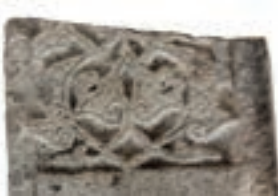
Resim 9. 313 nu