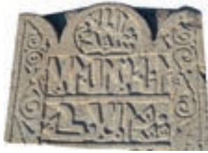
Resim 34. 192 nu