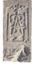
Resim 32. 182 nu (1368)