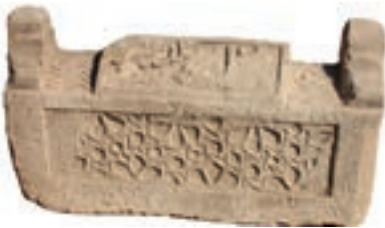
Resim 55. 223 nu.

Yıldız geçmeleri Beylikler dönemi mimarisinde de yaygınlığını sürdürür (Görür 2002). Malatya'daki 8, 10 ve 12 kollu yıldız geçmeli üç örnek kırık olduklarından tarihlerini bilmiyoruz. Tarihi bilinenlerin tamamı 14. yüzyıldan olduğu için bunları da aynı yüzyıla verebiliriz. Kol sayılarının azalması bakımından Ahlat'taki eğilime uygundurlar. Ancak sayıları azdır, işçilikleri döneminin mimarisine benzer ve belirli bir kaliteyi tutturmakla birlikte Ahlat'takiler daha iyidir. Çok kollu yıldız, Bağdat Köşkü'nden (1639) başlamak üzere Cumhuriyet dönemine kadar ahşap tavanlarda yaygınlığını sürdürmüştür (Çal 2008:159). 223 nu.lu örneğimizdeki gibi, İran Meraga Müzesi'ndeki taş sandukaların yan yüzlerinde, 8, 10, 12, kollu yıldız geçmesi işlenenlerden biri 1572 tarihlidir. Diğerlerinin tarihi belirtilmemiştir (Baş 2007).