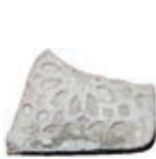
Resim 56. 214 nu