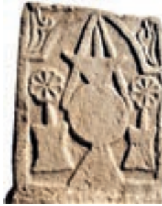
Resim 82. 162 nu (1359)