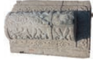
Resim 35. 188 nu

182 numaralı, Ahlat'tan 1293 ve 1320 tarihli iki mezar taşındaki düzenlemelerin devamıdır (Schneider 1989:104-105 /nu:368-369). 188 numaralı örneğimiz, Erciş'te 12. yüzyıla verilen, geniş bir oturtmalığın üstünde yükselen iki eğimli sandukayı andırır (Uluçam 2000: 24, E-29/ Fot. 143-146).