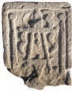
Resim 93. 295 nu (1375)