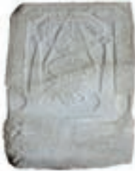
Resim 36. 1 nu

Düşey eksende dizili kesişen yarım daireler (Resim 36): Tek örneği tarihsizdir.