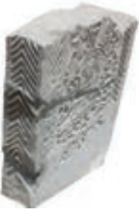
Resim 40. 156 nu

Üst üste tekrarlanmış “w” şeklinde çizgiler (Resim 42): 106, 111 (1375 tarihli), 223, 271 (1391 tarihli) örneklerimizde yer verilmiştir. Ankara’da 1356, 1368 (Küçükahmet 2009: kat. 16, 18) Beyşehir’de 1375 (Kunt vd 2014:378) tarihli sandukalarda kuşak olarak, Erciş’te 14. yüzyıla tarihlenecek yuvarlak? kemerli sandukanın kemerli yüzünde (Uluçam 2000: 26,AD-19), Bursa Muradiye Türbeleri haziresinde Bahaeddin Ali’nin ayak taşında (1424) (Güven 1995: Fot.75) işlenmiştir.