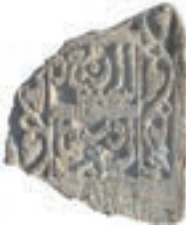
Resim 26. 216 nu

Yazı, kandil gibi ana düzenlemeyi tamamlayan bitkisel bezemeliler (Resim 26-35): Baş veya ayak taşlarında ana düzenleme olan yazıların ve kandillerin çevresi değişik biçimlerde kıvrık dallarla bezenmiştir. Bunların da ana yapısı, “s” biçimli dalın kıvrımları içine yerleştirilen rumilerden oluşur. 10 örnekte belirlenmiştir.