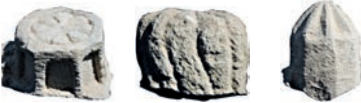
Resim 72. Etüdlük para Resim 73. Etüdlük para Resim 74. Etüdlük para Nesneli Bezeme (Resim 75-99)

Malatya Kırklar Mezarlıđındaki envantere aldığımız 312 mezar taşından 22, etüdlük nitelikteki 2 para olmak üzere toplam 24 tanesinde kandil işlenmiştir. Bunların 14 tanesinde kandillerin iki yanında birer tane de şamdan, bir envanterlik kırık parada ise yalnızca şamdan parasına yer verilmiştir.