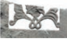
Resim 15. 301 nu