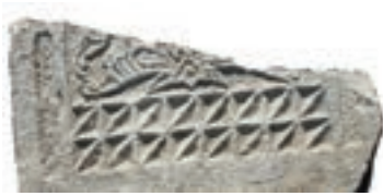
Resim 43. 199 nu

Çapraz iki eksenende bölünmüşler (Resim 44-45): İki örneğimiz de tarihlidir: kat. 243 (1388), kat. 271 (1391). İstanbul Kısıklı'da 15. yüzyıla verilen bir mezar taşında tekrarlanmıştır (Güven 1995: Fot.317). İki alt tipine de benzer daire içinde düzenleme, Sivas Müzesi'nde bir mezar taşındadır (14. yüzyıl?) (Karamağaralı 1992: 11, Fot.34) Zile Şeyh Nusret Türbesi (1353 tarihli vakfiyesi var) revak direğinin ağaçtan yastığına oyulmuş benzer motifler, bu tipin 14. yüzyıla kadar indiğini gösteriyor (Çal 1987:431). Özellikle ağaçtan yapı elemanlarında ve Erzincan'daki 1905 tarihli örneği itibarıyla (Çal 2007a:132) taştan mezarlarda Cumhuriyet dönemine kadar yaygın olduğunu söyleyebiliriz.